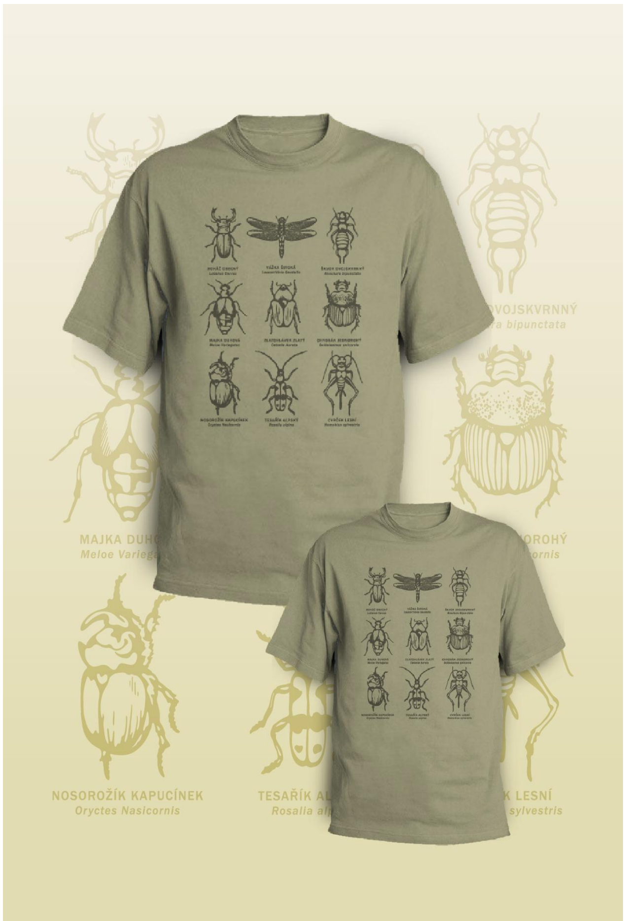
Sbírka hmyzu s českým a latinským názvem